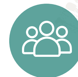
Presentación a miembros del CONACAFE