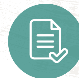
Aprobación y publicación de la política en el Diario Oficial La Gaceta el 17 de mayo del 2021