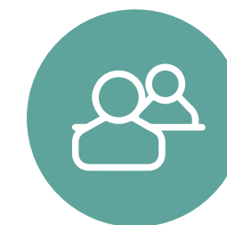
Entrevistas con actores nacionales