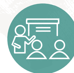
Taller nación de socialización y validación de la política