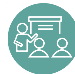
Talleres de consulta sectoriales