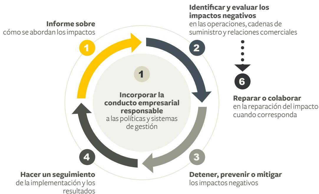
Figura 2. Proceso de la Diligencia Debida según la OCDE

Se espera que una Debida Diligencia eficaz se apoye en medidas que integren la conducta empresarial responsable dentro de las políticas y sistemas de gestión de la empresa, de tal forma que las empresas puedan reparar los impactos negativos que causan o a los que contribuyen (OCDE, 2018). Esta Debida Diligencia es planteada como un proceso que, en términos generales, consta de seis etapas, tal como se muestra en la Figura 2 . A partir de este modelo, cada norma puede hacer los ajustes requeridos para alcanzar el fin específico con el cual es creada.